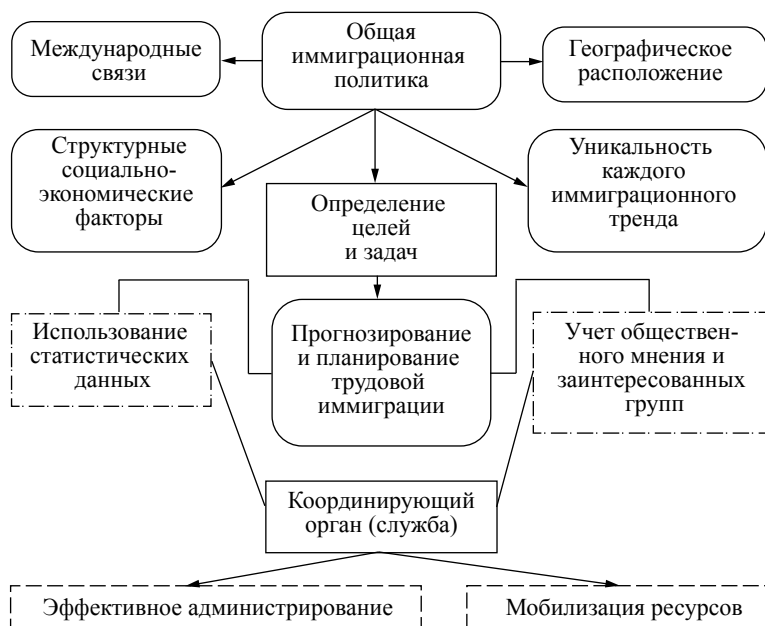
Рис. 2. Механизм реализации миграционной политики